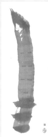
玉璋（ぎょくしょう）のイメージ画（華林）

そこで発掘されたまさにカルチャーショックともいえる数々の個性豊かな遺品のなかに『玉璋（玉石でできた刀）』がありました。もちろん祭祀のための劍で、この文明が滅ぼされた後の、やや離れた金沙遺跡でも同様のものが発掘されており、飛び咲きするような不思議な文化の連鎖がみられることもたいへん興味深いところでした。