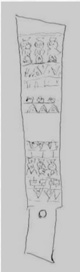
玉璋（ぎよくしょう）のイメージ画（華林）

このころの祭祀のための玉石の劔は、形状によって玉璋または玉圭と呼ばれ、紀元前十七世紀ごろの河南省の二里頭遺跡や、三星堆と同じようなころの陝西省、湖北省、福建省、広東省やヴェトナムなどにもみられるそうです。つまり中国に統一国家ができる以前に広範な地域の幾多の場所で祭祀にもちいられていたということで、さらに古くは紀元前二五〇〇年～二〇〇〇年（新石器時代）の龍山文化（山東省）にも同様のものがあるそうです。同じ系統の非常によく似たこれらの祭祀の文化が遠く離れた場所で時代もおおきくへだてて別々に定着していたことは、考えてみれば不思議なことです。この事実はアジアを語るうえで重要でしょう。